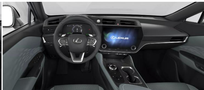
GREYSCALE TAHARA TRIM (EA10)