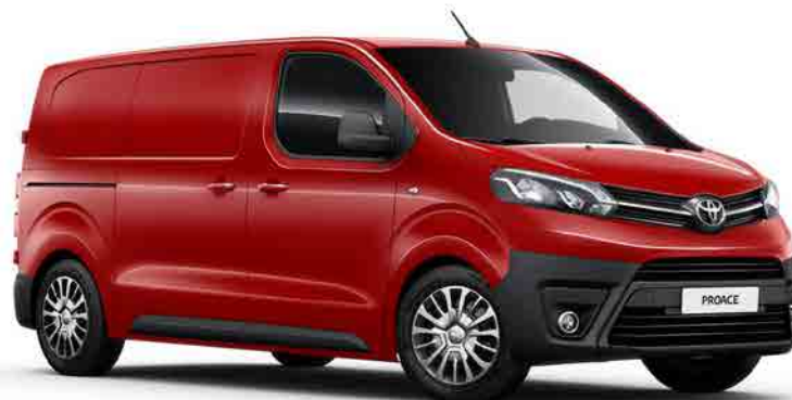
KJF Supreme Red