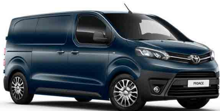
KNP Majestic Blue