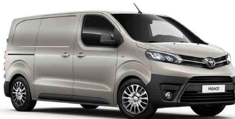
NEU Grey Limestone*