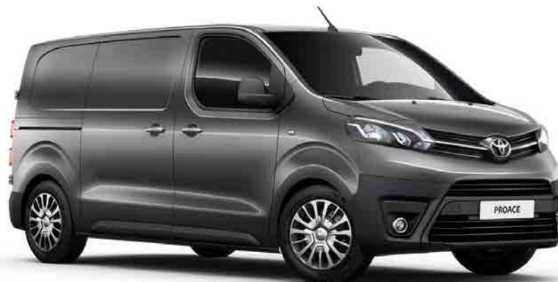
EVL Falcon Grey*