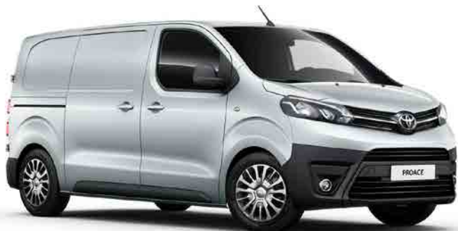
EZR Atonium Silver*