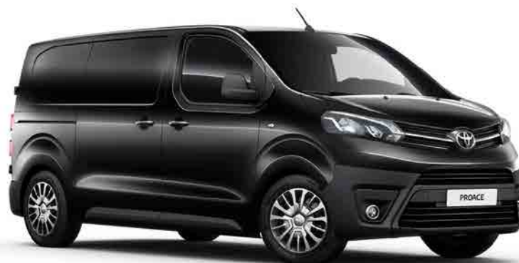
EXY Misty Black