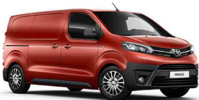
KHK Carnelian Orange*