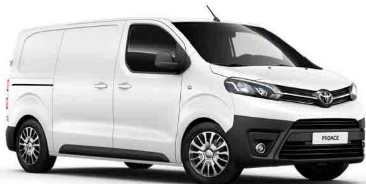
EWP Arctic White