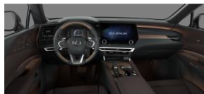
Dark Sepia Semi Aniline leather / Bamboo inlays (LA47)