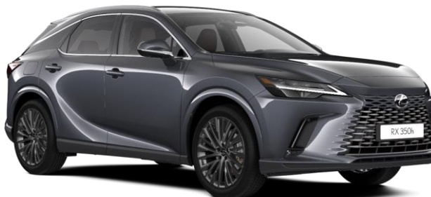
Paveikslėlis - iliustratyvus pobūdžio