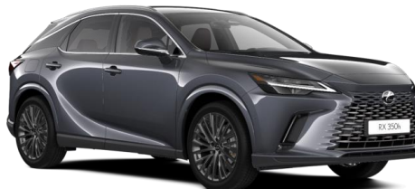
Paveikslėlis - iliustratyvaus pobūdžio