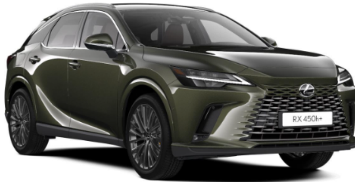
Paveikslėlis - iliustratyvus pobūdžio