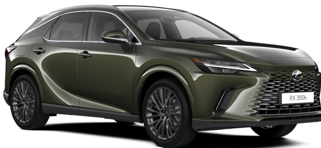
Paveikslėlis - iliustratyvus pobūdžio