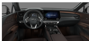
Dark Sepia Semi Aniline leather / Ash SumiBlack inlays (LA46)