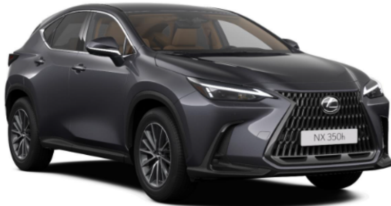
Paveikslėlis - iliustratyvus pobūdžio