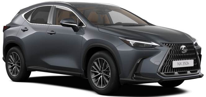
Paveikslėlis - iliustratyvus pobūdžio