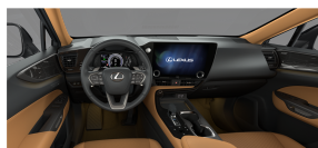
Hazel Smooth leather / Silver inlays (LA41)