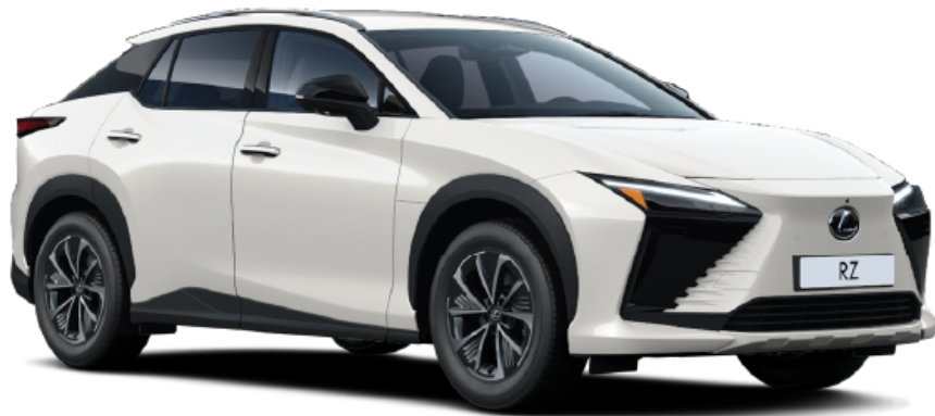
Paveikslėlis - iliustratyvus pobūdžio