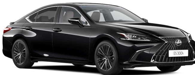
Paveikslėlis - iliustratyvaus pobūdžio