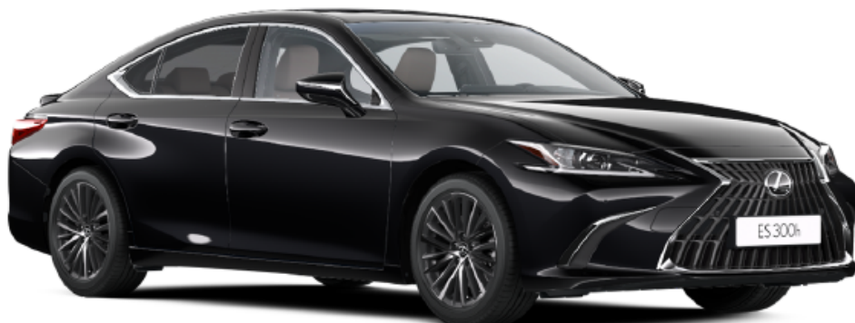
Paveikslėlis - iliustratyvus pobūdžio