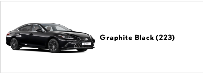
Graphite Black (223)