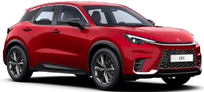
Paveikslėlis - iliustratyvus pobūdžio