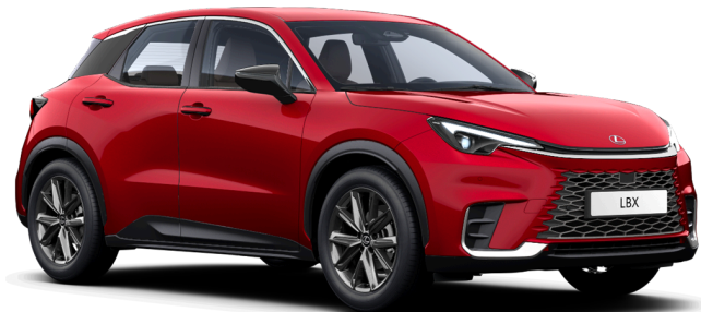
Paveikslėlis - iliustratyvus pobūdžio