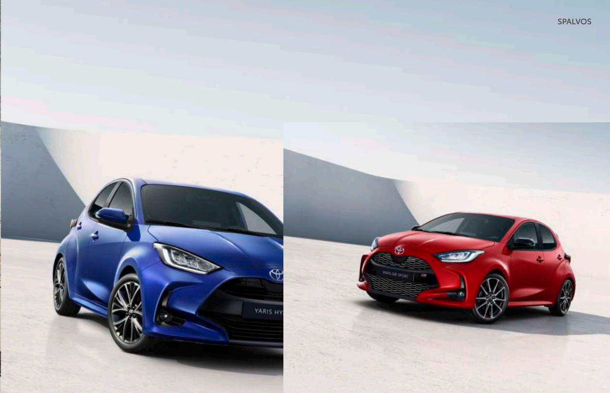
Vienspalviai Yaris variantai