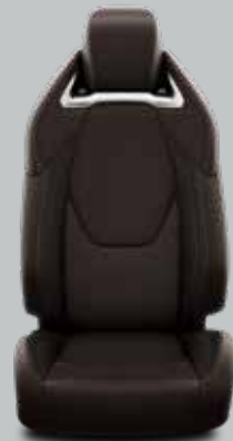
Ruda perforuota oda su matinio chromo apdaila Papildoma Luxury Plus modelių komplektacija