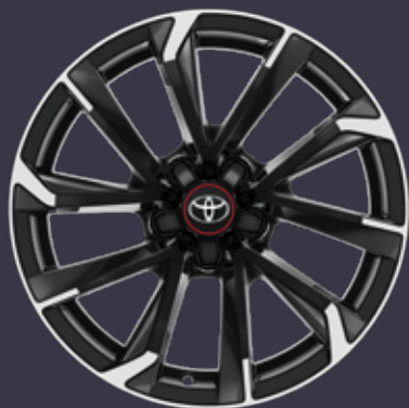
18 colių dvispalviai (juodi) poliruoti lengvojo lydinio ratlankiai (5 dvigubų stipinų) Standartinė GR Sport Plus komplektacija, išskyrus Touring Sports modelius su 1,8 l hibridiniu varikliu