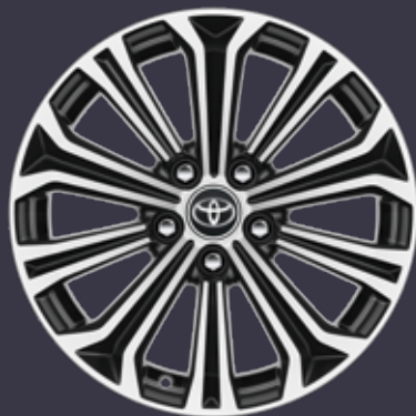
17 colių juodi poliruoti lengvojo lydinio ratlankiai (10 stipinų) Standartinė Luxury ir Luxury Plus modelių komplektacija, išskyrus Luxury Plus su 2,0 l hibridiniu varikliu