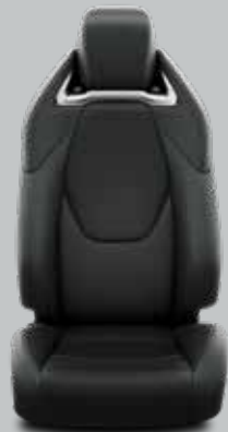
Juoda perforuota oda su matinio chromo apdaila Standartinė Luxury Plus modelių komplektacija