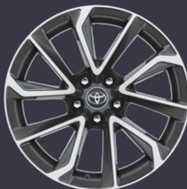
18 colių dvispalviai (pilki) poliruoti lengvojo lydinio ratlankiai (5 dvigubų stipinų) Standartinė Luxury Plus su 2,0 l hibridiniu varikliu modelių komplektacija