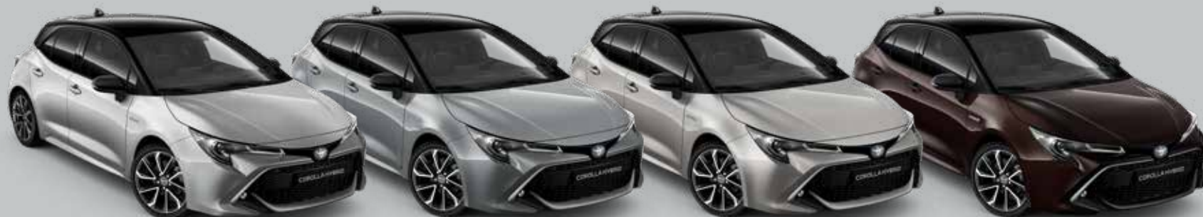
1F7 Ultra Silver 50