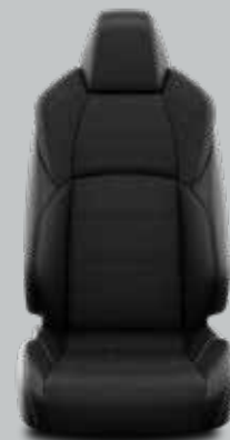
Tamsiai pilka dygsniuota tekstilė ir dirbtinė oda, pilkos siūlės Standartinė Active Plus modelių komplektacija