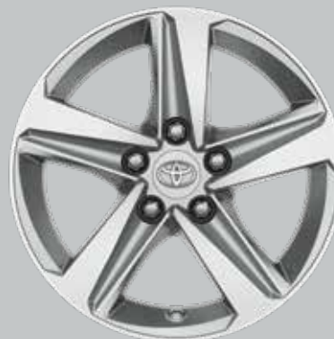
16 colių sidabriniai lengvojo lydinio ratlankiai (5 stipinų) Papildoma visų modelių komplektacija