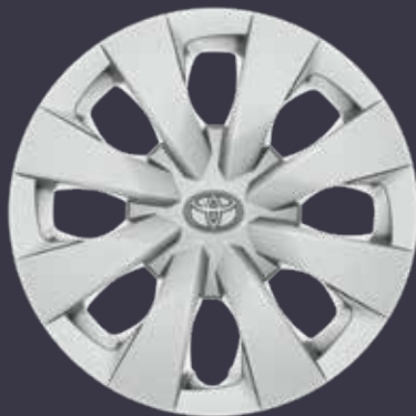
15 colių plieniniai ratlankiai su gaubtais (6 dvigubų stipinų) Standartinė Standard modelių komplektacija