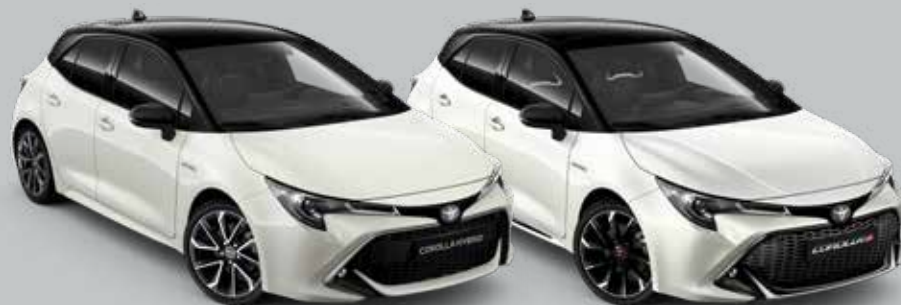
070 Pearl White °