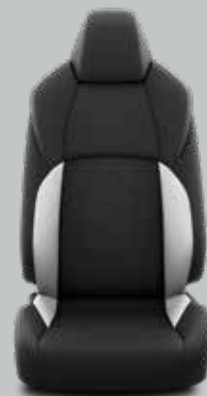
Juoda / pilka dygsniuota tekstilė, pilkos siūlės Standartinė Standard ir Active modelių komplektacija