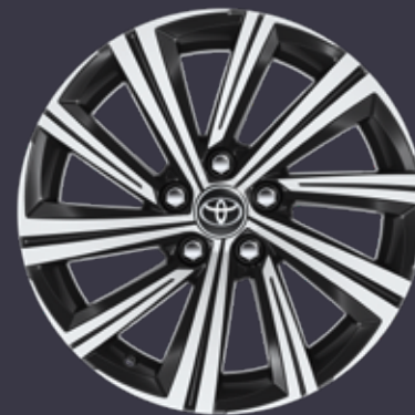
17 colių juodi poliruoti lengvojo lydinio ratlankiai (10 stipinų) Standartinė Active Plus modelių komplektacija