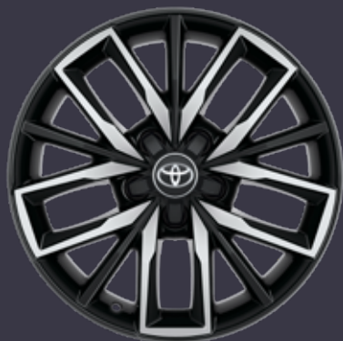
17 colių juodi poliruoti lengvojo lydinio ratlankiai (5 dvigubų stipinų) Standartinė TREK modelių komplektacija