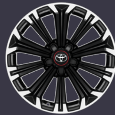
17 colių poliruoti lengvojo lydinio ratlankiai (10 stipinų) Standartinė GR Sport ir GR Sport Plus Touring Sports modelių su 1,8 l hibridiniu varikliu komplektacija