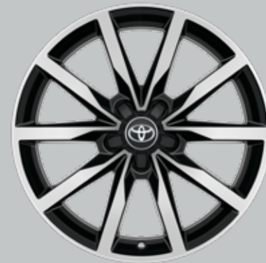
18 colių juodi poliruoti lengvojo lydinio ratlankiai (5 dvigubų stipinų) Papildoma visų modelių komplektacija