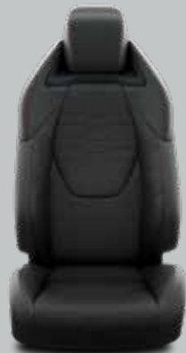
Juodi / pilki apmušalai su odine apdaila ir juodomis detalėmis Standartinė Luxury modelių komplektacija