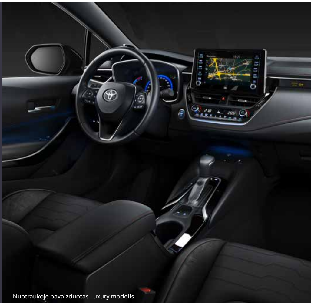
Nuotraukoje pavaizduotas Luxury modelis.