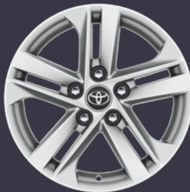
16 colių lengvojo lydinio ratlankiai (5 dvigubų stipinų) Standartinė Active modelių komplektacija