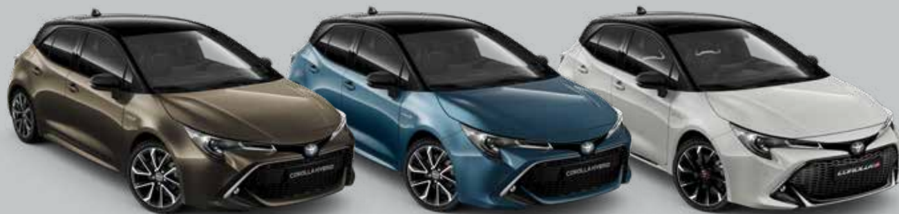
6X1 Oxyde Bronze § 0 55