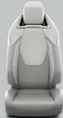
Pilka perforuota oda su matinio chromo apdaila Papildoma Luxury Plus modelių komplektacija