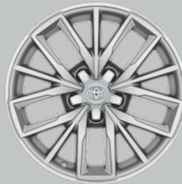
17 colių sidabriniai lengvojo lydinio ratlankiai (5 trigubų stipinų) Papildoma visų modelių komplektacija