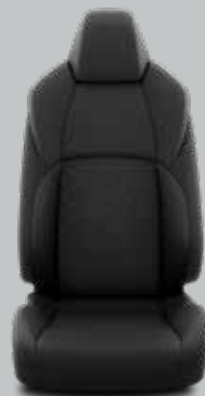
Juoda dygsniuota tekstilė, pilkos siūlės Standartinė Standard ir Active modelių komplektacija