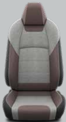
Ruda / pilka tekstilė su pilkomis siūlėmis Standartinė TREK modelių komplektacija