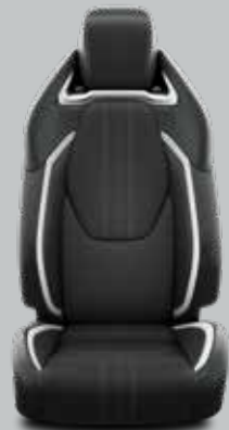
Pilka tekstilė su juodomis dirbtinės odos detalėmis ir matinio chromo apdaila Standartinė GR Sport ir GR Sport Plus modelių komplektacija