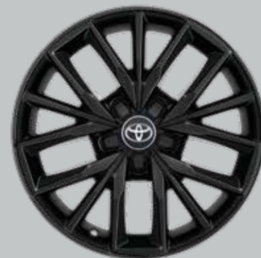
17 colių juodi lengvojo lydinio ratlankiai (5 trigubų stipinų) Papildoma visų modelių komplektacija