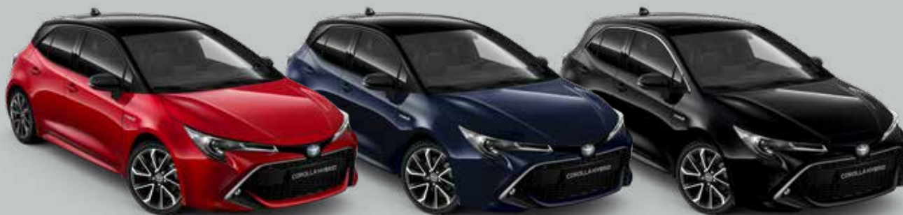
3U5 Emotional Red 2* 0