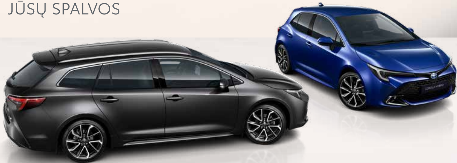
Corolla spalvų variantai**