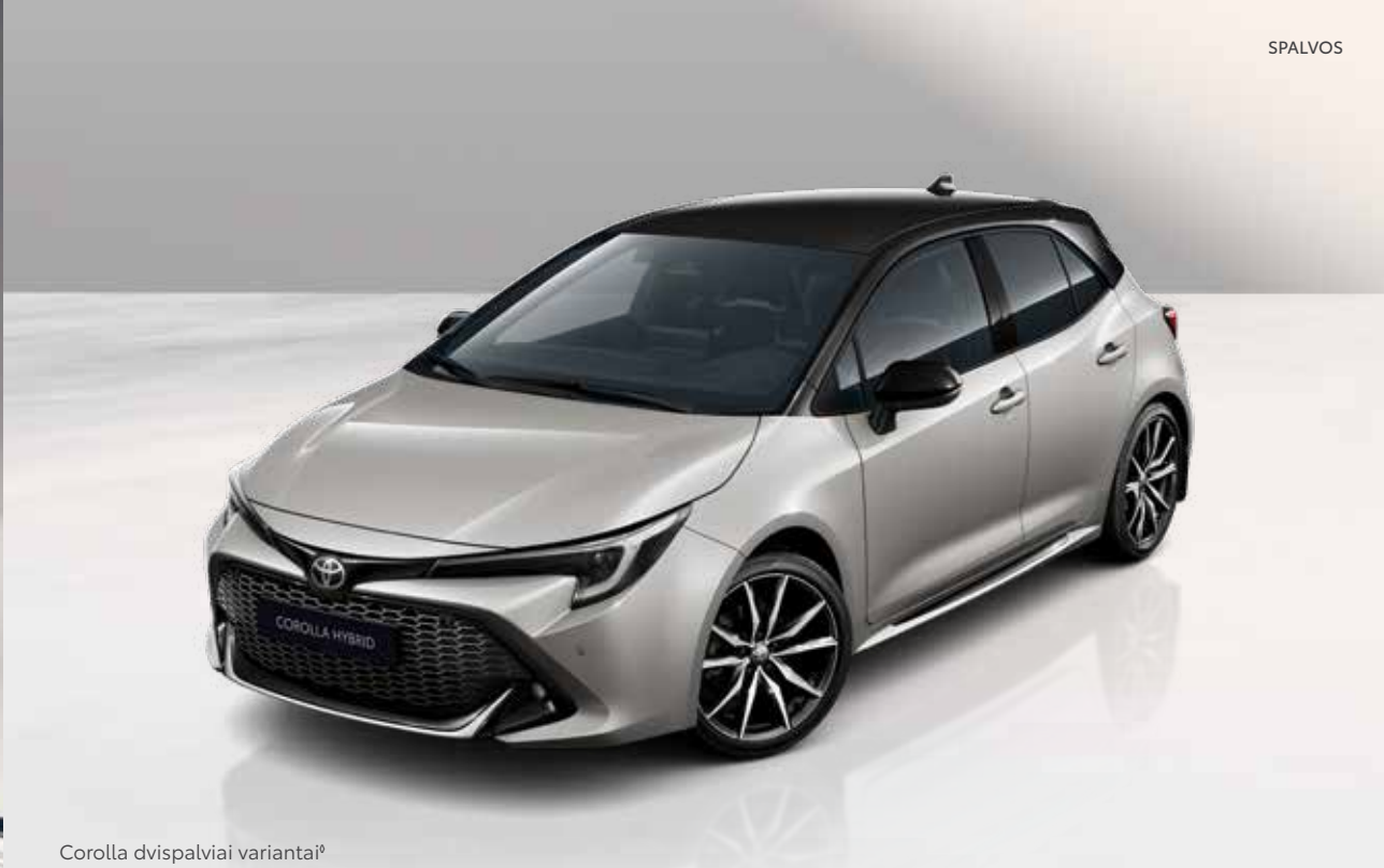
Corolla dvispalviai variantai 9