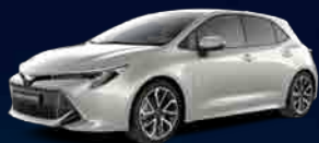
1J6 Precious Silver §