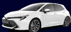
040 Pure White