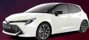
2KR Bi-tone Pearl White § **