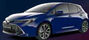
8Q4 Marine Blue