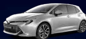
1F7 Ultra Silver*