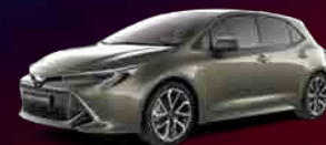
6X1 Oxide Bronze*