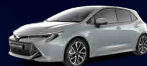
1H5 Cement Gray*