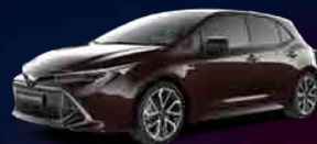
4W9 Phantom Brown*