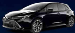
209 Night Sky Black*