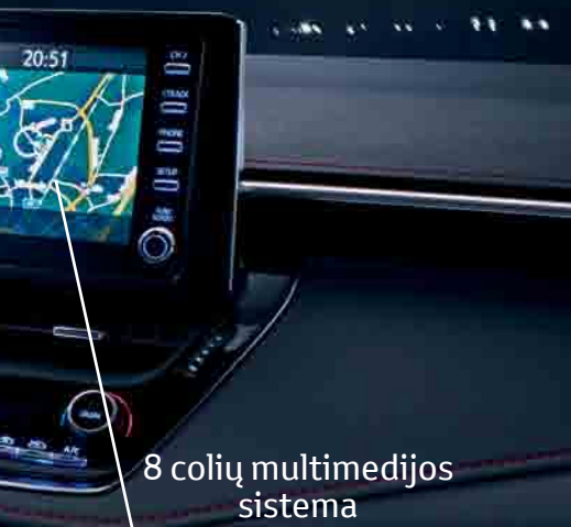
8 colių multimedijos sistema