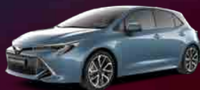
8U6 Denim Blue*