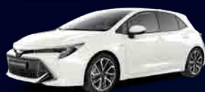
070 Pearl White §