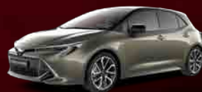
2RF Bi-tone Oxide Bronze***