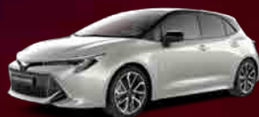
2RD Bi-tone Precious Silver § **