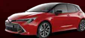
2SZ Bi-tone Emotional Red 2 § **

* Metalo blizgesio dažai § Dažai su perlamutriniu efektu