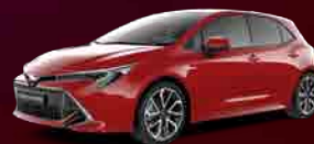
3U5 Emotional Red 2 §